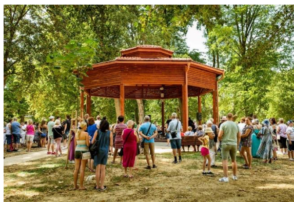
Sátoraljaújhelyi Széphalom park