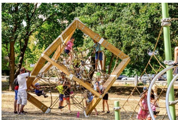
Nagymihályi Kerta park

A projekt célja a nagymihályi Kerta natúrpark és a sátoraljaújhelyi Széphalom park újjáélesztése volt. Az ültetés és a fagondozás, a kisparképítészet és a járdahálózat helyreállítása jelentősen javította a beépített városi területen a környezet vonzerejét. A történelmi növényzet helyreállítása során a helyben elérhető természeti örökség megőrzése volt a cél.